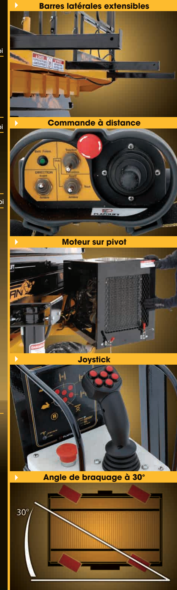
▶ Barres latérales extensibles